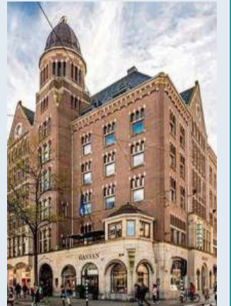
De Industriële Groote Club (boven) en de voormalige Groote Club op de Dam.